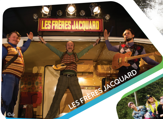
LES FRÈRES JACQUARD