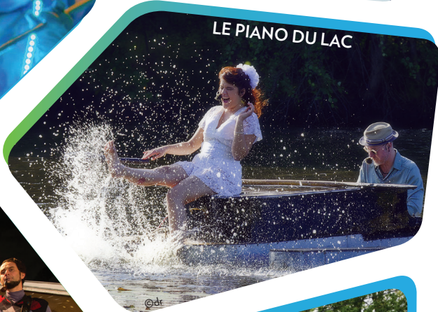
LE PIANO DU LAC